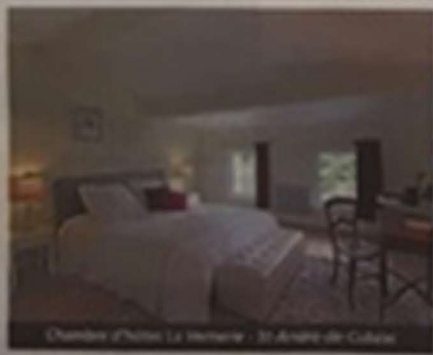
Chambre d'hôte La Terrasse - St André de Cubzac