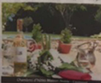
Chambre d'hôte Bellemeuse - Lamoignon